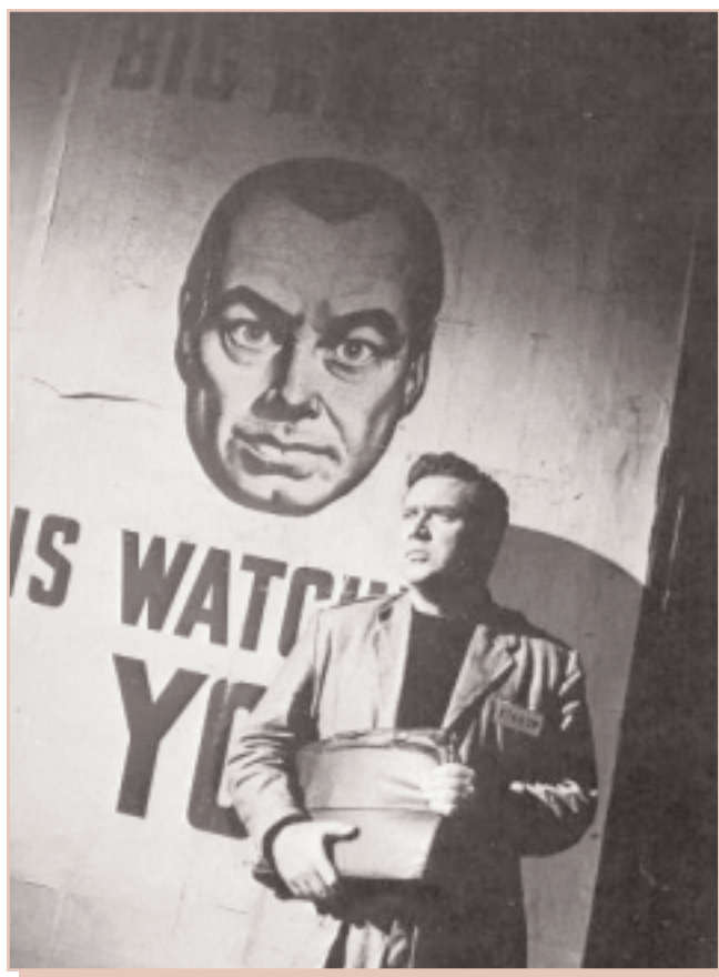
Imagen 1. Edmon O'Brien interpretando a Winston Smith en la película 1984 (1956) de Michael Anderson.

En esta misma época se sitúa otra predicción de futuro, expresada en este caso desde el ámbito científico. En 1945, el científico e ingeniero Vannevar Bush escribió un artículo para la revista Atlantic Monthly titulado «As we may think», en el que describía un artilugio que denominó Memex (contracción de memory extender , «expansor de memoria»), y que consistía en un gran escritorio dotado de pantallas translúcidas en las que podían proyectarse a voluntad textos e imágenes de un archivo en microfilme que se conservaría en el interior del aparato. Las ideas de Bush prefiguraron de forma conceptual lo que cuarenta años más tarde sería el ordenador personal e influyeron directamente en Douglas Engelbart, quien inventó el ratón y fue pionero en el desarrollo de la interfaz gráfica de usuario y el hipertexto.