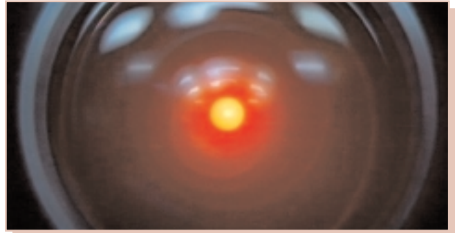
Imagen 3. Detalle del «ojo» de HAL 9000, de la película 2001: una odisea del espacio (1968), de Stanley Kubrick.

La década de 1970 ve el nacimiento de las tecnologías que darán forma a la actual sociedad de la información. En 1969, el Departamento de Defensa de los Estados Unidos crea Advanced Research Projects Agency Network (ARPANET), la primera red de comunicación entre ordenadores basada en la transmisión de paquetes de información. El concepto inicial de dicha red partía de las ideas de J.C.R. Licklider, ingeniero del MIT, quien ya en 1962 expresó en una serie de anotaciones su concepto de una «red galáctica», que contenía la mayoría de los aspectos de lo que es hoy en día Internet.