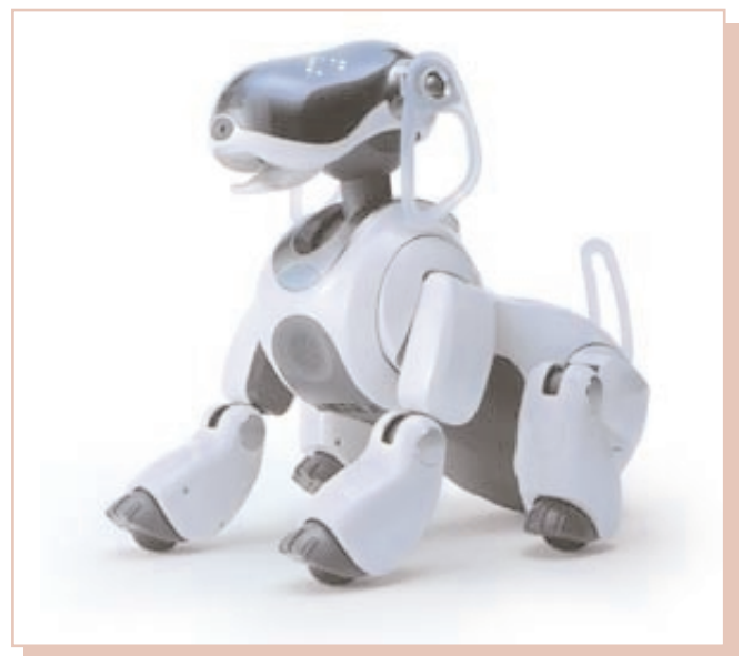
Imagen 5. Robot Aibo, de Sony.

El objeto se convierte en otros casos en receptor de las necesidades afectivas del individuo. Sherry Turkle define como «artefactos relacionales» una serie de productos que han ido saliendo al mercado en los últimos años y que se presentan como seres sociales con los que entablar una relación. Turkle ha desarrollado un estudio en el que ha preguntado a los usuarios de este tipo de objetos acerca de sus sentimientos hacia ellos. Dos de los aspectos más destacados han sido la posibilidad de establecer una relación afectiva «segura» (dado que el robot no realizará acciones que dañen al usuario, ni le abandonará) y el hecho de que el robot no va a morir nunca. Es lógico prever que el desarrollo de este tipo de robots va a proseguir en el futuro y que pronto la relación con seres artificiales, afectiva o no, será común. Lo que se plantea entonces es qué tipo de relación resulta deseable.